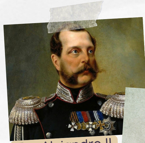
Zar Alejandro II

Aunque el evento nunca se llevó a cabo debido al asesinato del zar, la obra se estrenó exitosamente en San Petersburgo en 1880, bajo la dirección de Rimski-Kórsakov, ganando popularidad en Rusia y Europa.